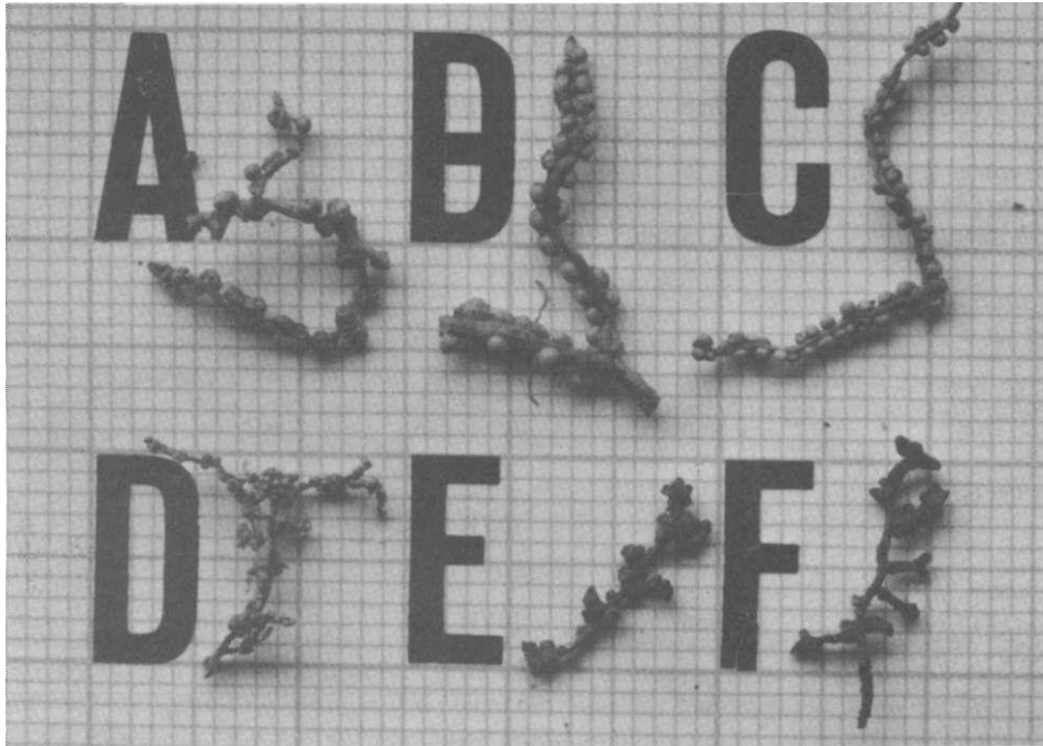
Fig. 1: Nodulación radicular en Podocarpaceae y Araucariaceae .

comparativamente mayores tamaños y cantidad, y su distribución es regular y diametralmente simétrica y opuesta al eje radicular (Figs. 1 y 2). En condiciones de sustrato menos nutritivo, por ejemplo, en suelo ácido, derivado de rocas